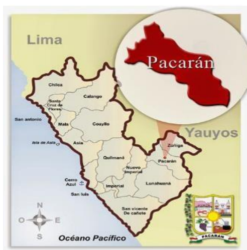
Figura N° 1 Ubicación geográfica del distrito de Pacarán

Nota: La imagen muestra la ubicación geográfica del distrito de Pacarán en la provincia de Cañete, Lima.